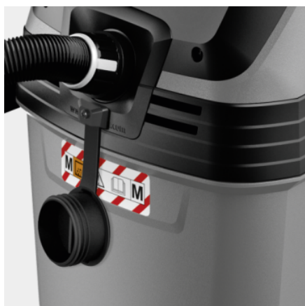
Säkerhetsdammsugare i dammclass M